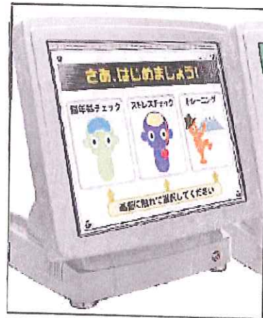
2. 脳年齢・血管年齢測定器